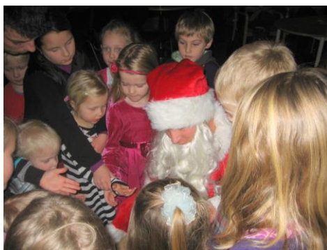
Bilde 10: Nissen hadde selvsagt noe i sekken sin.

Det ble gjort en rask undersøkelse om andre skulle arrangere juletreff i romjulen. Vi kontaktet Nor Misjon, Soar, Bø Bedehus med flere. Siden flere gav inntrykk av at de ønsket juletreff, tok daglig leder initiativ til arrangementet. Det ble et stort arrangement med 90 gjester , middag, dans, kaker, gaver, nisse og konkurranser.