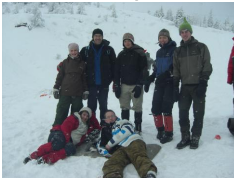
Bilde 5: Det er like moro for de frivillige som deltakerne på Vinteropplevelser.

Bø Frivilligsentral var også behjelpelig med å få flyktingene fra Voksenopplæringen i Bø opp til Bø Sommarland i juni, da det var gratis inngang. Vi leide minibuss fra Bø kommune.