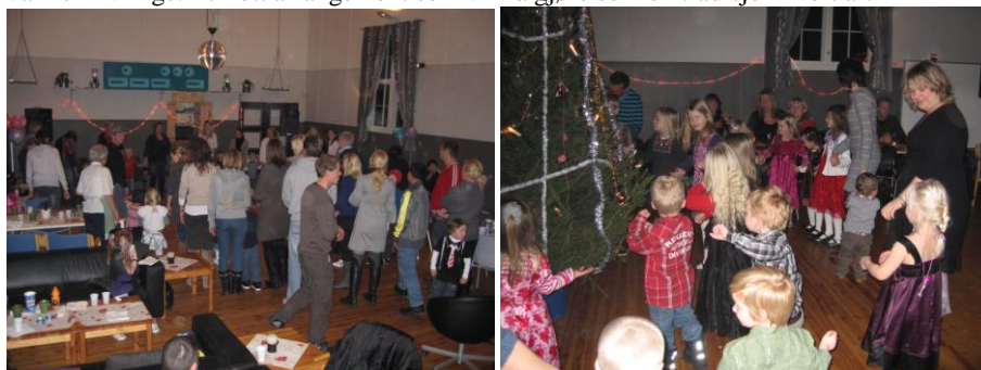
Bilde 4: Fullt hus og moro på Småbarnsdisco i november og Juletreff i romjula.

BøF inviterte videre til Juletreff, 30. desember 2010 . Det meldte seg på 90 gjester og vi var 15 frivillige. Et flott arrangement som vi må gjøre som en tradisjon hvert år.