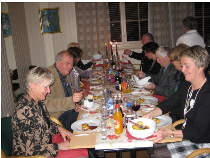
Bilde 11: Gjestene på jubileumsfesten kunne nyte deilig mat og god stemning.