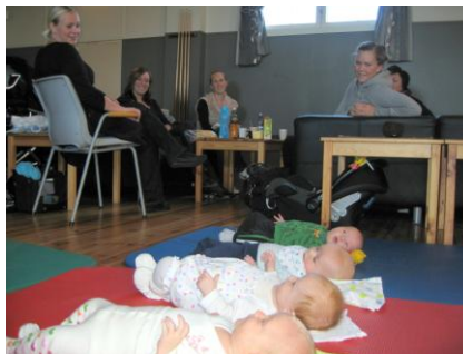
Bilde 3: Småbarnstreff – fint for babyer og foreldre.

Veldig koselig med mange babyer og mammaer i huset!