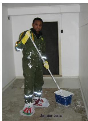
Bilde 13: Oppussingen ble utført av Negasi.

Kjellergangen ble fin, og vi fikk investert i nye småvarereoler.