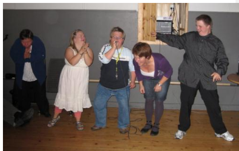
Bilde 2: Karaoke er veldig populært!

Fredagsdisco/galla gjennomført 10 ganger . Gjennomsnittlig 45 gjester og 4 frivillige hver gang. Vårgalla gjennomført 30. april og Høstgalla 29. oktober. Gjennomsnittlig 70 gjester og 12 frivillige hver gang. I samarbeid med Norsk Forbund for Utviklingshemmede (NFU, Telemark), som stiller med 1 frivillig hver gang.